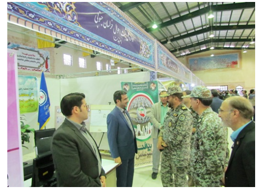
آدرس صفحه :